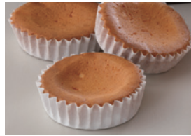
焼き菓子の風味を強調