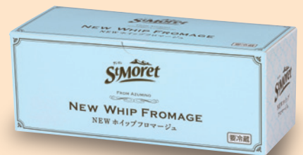
サンモレ NEW ホイップフロマージュ