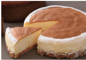
味や香りに濃厚感を出せる

商品名：サンモレ クリームチーズ カマンベール配合 タイプ：ソフト 荷姿：1kg×12、150g×24、10kg×1（特別生産） 種類別：プロセスチーズ 賞味期限：製造後180日 要冷蔵