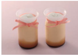
コクのあるプリンに