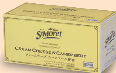
サンモレ クリームチーズ カマンベール配合

※カマンベール スフレチーズケーキに使用しているサンモレ クリームチーズ カマンベール配合は、クリームチーズをベースにカマンベールを配合したクリームチーズのため、カマンベールチーズには出せない、コクのある風味としっとりした食感に仕上がります。スフレチーズケーキに使用しているサンモレNEWホイップフロマージュは、空気を抱き込んでいるクリームチーズのため、ふんわりした爽やかな酸味の軽い食感に仕上がります。