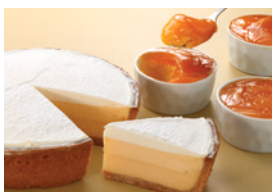
ムースやアパレイユに

商品名：サンモレ クリームチーズ “フレンチレシピ” タイプ：ソフト 荷姿：1kg×12、10kg×1 種類別：プロセスチーズ 賞味期限：製造後180日 要冷蔵