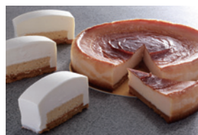
ベイクドチーズケーキとして