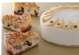
レアチーズケーキとして