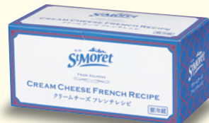
サンモレ クリームチーズ “フレンチレシビ”