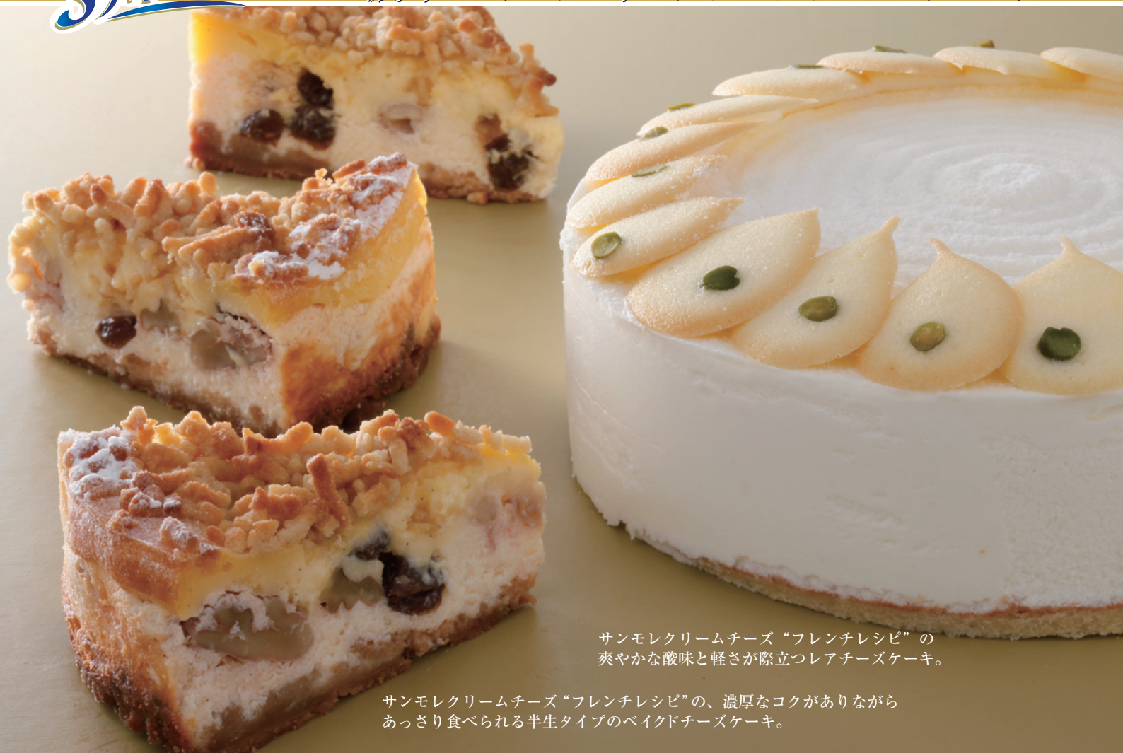
サンモレクリームチーズ“フレンチレシビ”の爽やかな酸味と軽さが際立つレアチーズケーキ。

サンモレクリームチーズ“フレンチレシビ”の、濃厚なコクがありながらあっさり食べられる半生タイプのベイクドチーズケーキ。