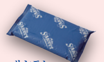
サンモレ フロマージュブルー