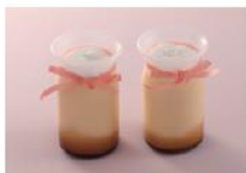
コクのあるプリンに