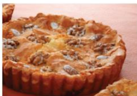
焼き菓子の隠し味に

商品名：サンモレ フロマージュ ブルー タイプ：ソフト 荷姿：200g×20、1kg×15 名称：乳等を主要原料とする食品 賞味期限：製造後180日 要冷蔵