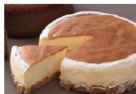
味や香りに濃厚感を出せる