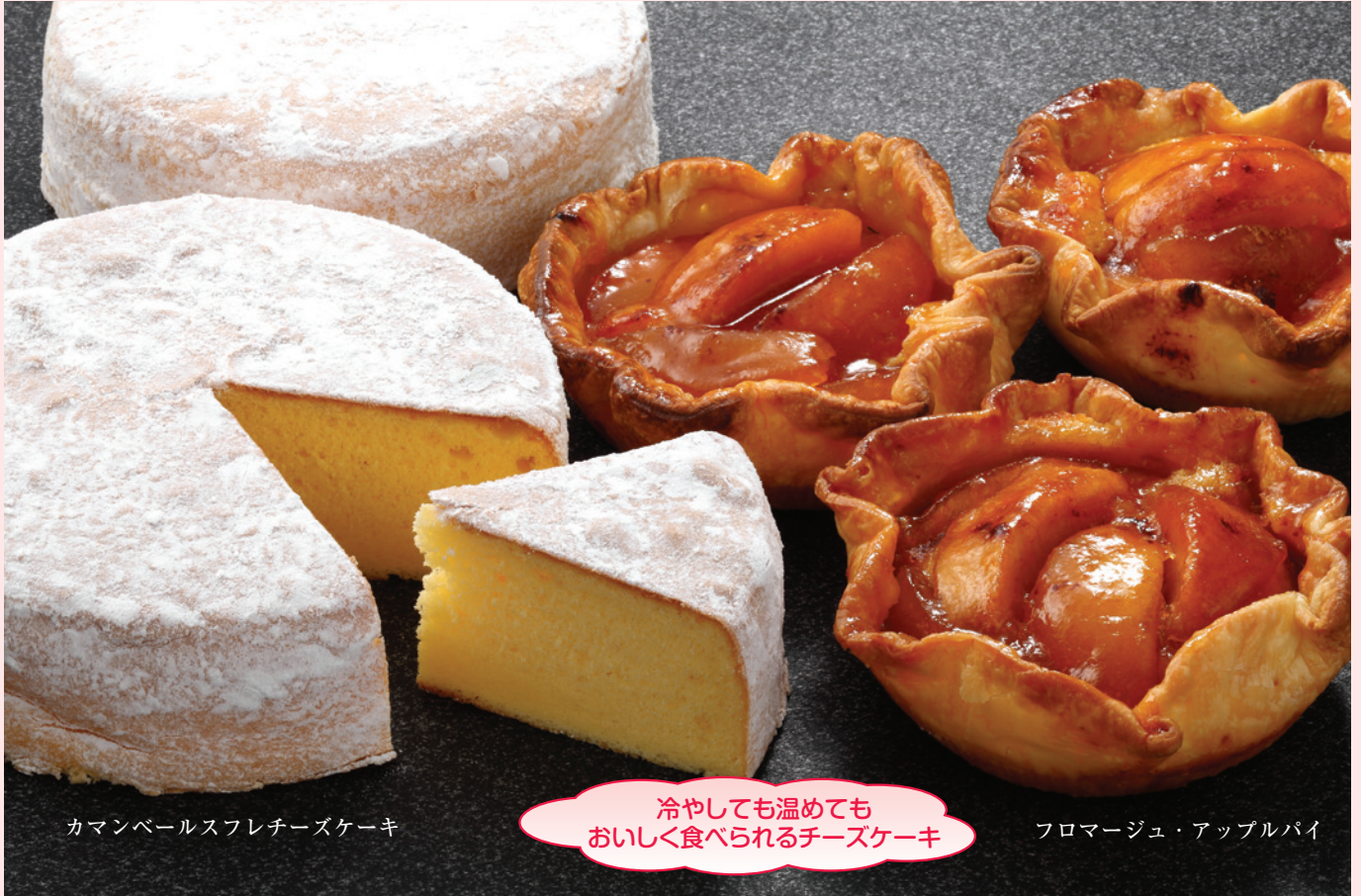
カマンベールスフレチーズケーキ