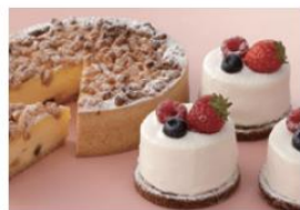
クリームのコク出しに