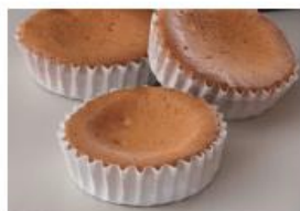
焼き菓子の風味を強調

商品名：サンモレ クリームチーズ カマンベール配合 タイプ：ソフト 荷姿：1kg×12、150g×24、10kg×1（特別生産） 種類別：プロセスチーズ 賞味期限：製造後180日 要冷蔵