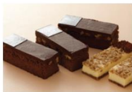
焼き菓子・クリームの隠し味に