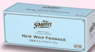
サンモレ NEW ホイップフロマージュ