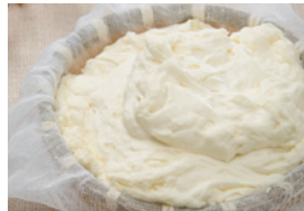
フロマージュクリームとして スフレチーズ（窯落ちしない） ムースやクレム・ダンジュに