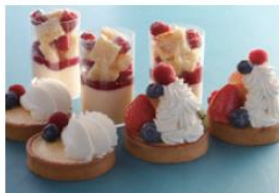
アパレイユやカスタードクリーム of 隠し味に