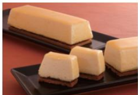
チーズケーキの甘味出しに