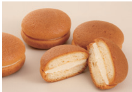
フロマージュクリームとして

商品名：サンモレ NEW ホイップフロマージュ タイプ：超ソフト 荷姿：1kg×12、150g×24、10kg×1（特別生産） 種類別：ナチュラルチーズ 賞味期限：製造後150日 要冷蔵