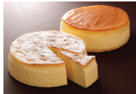
スフレチーズ（窯落ちしない）